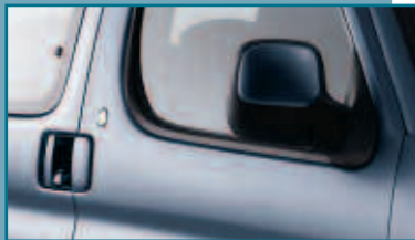
Coquilles de rétroviseurs et poignées de portes couleur caisse.