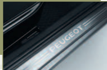
Seuils de portes avant sérigraphiés « Peugeot ».