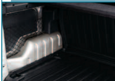
Filet sur le passage de roue arrière gauche.