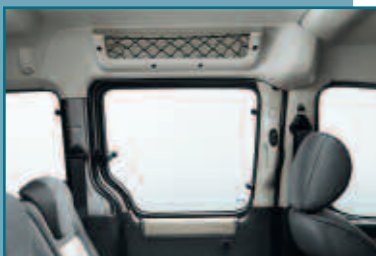
Filets de rangement au dessus des vitres latérales centrales.