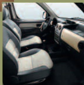
Ambiance cèdre. Tissu Totem Beige. Décor « Champagne ».